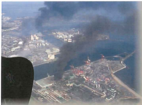
3月14日仙台港付近

(対象:一般市民、東日本大震災復興 NPO 支援・全国プロジェクト会員・入会希望:計 600 人)